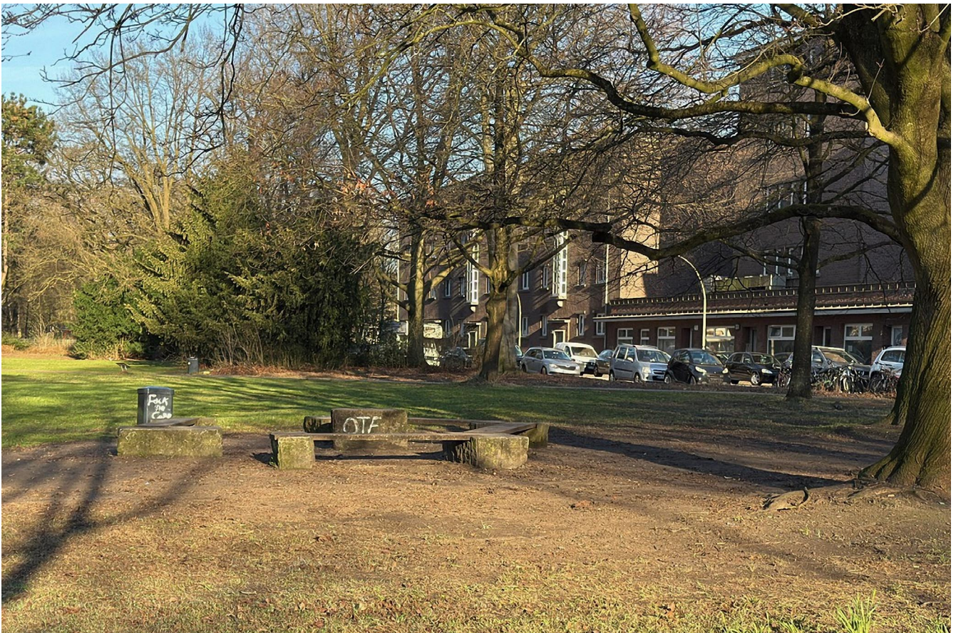
Parkähnliche, grüne Wiese mit Verweilmöglichkeiten