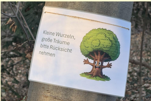
Auch die junge Generation sorgt sich um den Wald