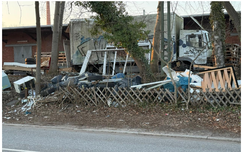
... Elektrogroßgeräte ...