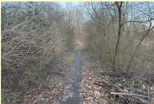
Zurückgeschnittene Bäume und Sträucher