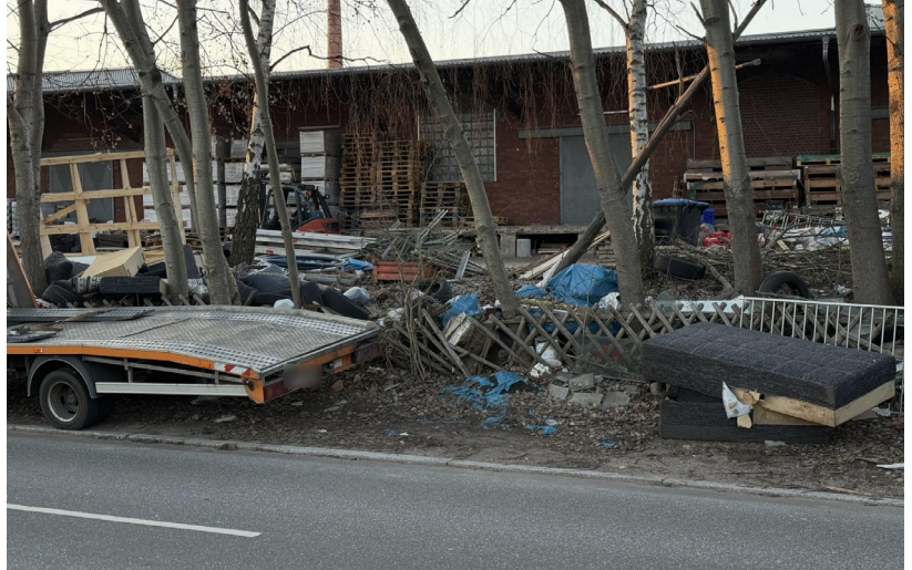
Reifen, große Möbelstücke und ...

Unverständlich bleibt aber nach wie vor, dass keine öffentliche Behörde eingreift an Stellen, an denen große Möbelstücke oder Elektrogroßgeräte den abgrenzenden Zaun des Geländes niedergedrückt haben und somit auf den Auto-Abstellflächen an der nördlichen Straßenseite der Gustav-Adolf-Straße und somit öffentlichem Gelände liegen.