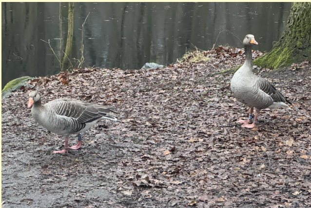
Eine Graugans ist im großen Teich verblieben