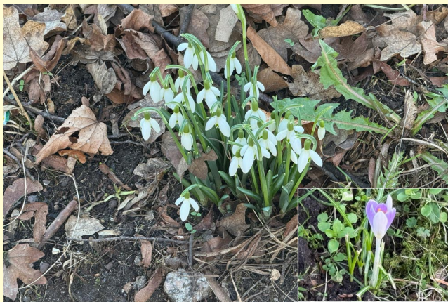
Die ersten Anzeichen für das Ende des Winters