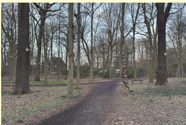
Nicht zu übersehen