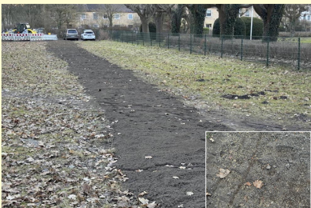
Wiederherstellung der bekannten grünen Wiese