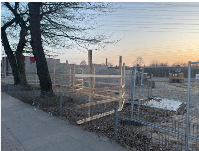
Schweres Baugerät auf der Baustelle – und glücklicherweise Erhalt der drei mächtigen Eichen

Lange in Planung, nun mit Frühlingsbeginn auch der Baubeginn: Marienthal bekommt einen zweiten Discounter!