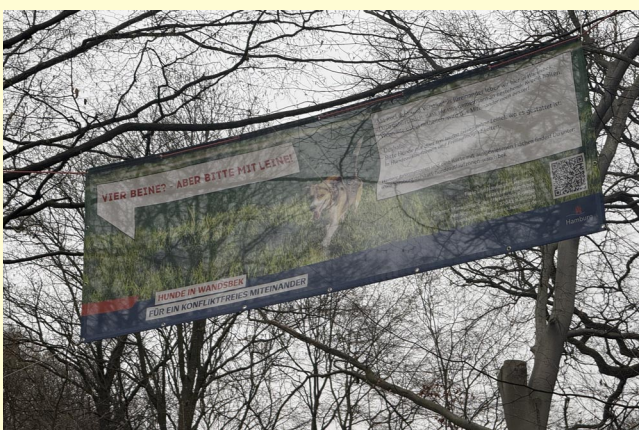
Leinenpflicht – oder Gehorsamkeits-Training