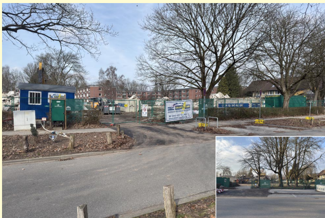
Einige Häuser mussten abgerissen werden