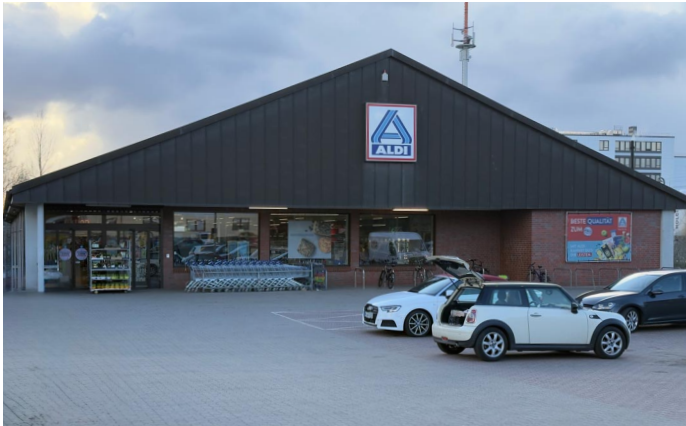
Sie wird in dieser Form nicht bestehen

Wichtig aber für alle Anwohner und Nachbarn: Aldi kommt zurück und eröffnet die dann neue Filiale Ende des Jahres 2026!