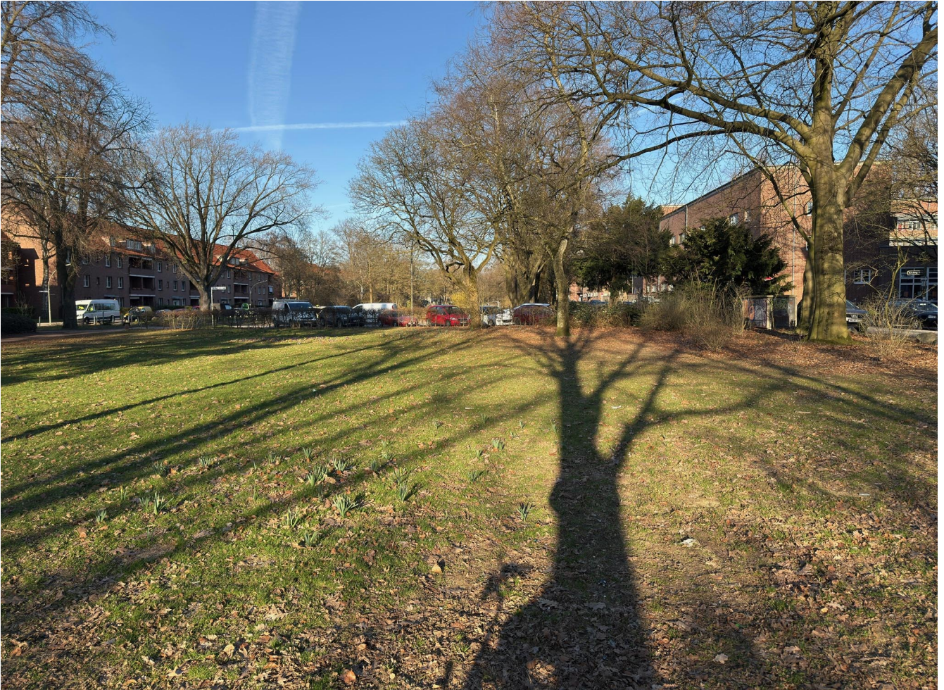
Eine der gewöhnlichen Wiesen im Grünzug