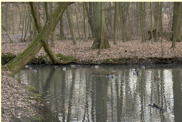
Wieder zurück in der Heimat