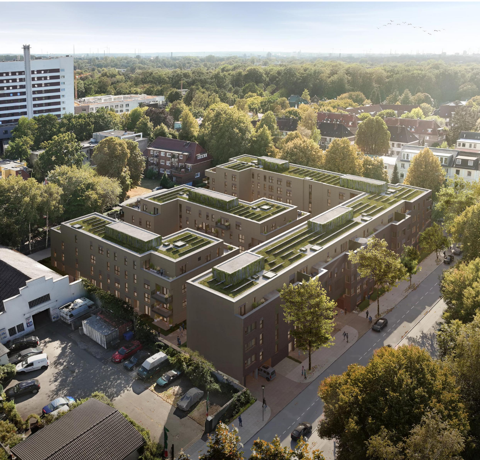
Die geplanten vier Wohnblöcke

2025 weiter gehen würden. Und die Baugrube nicht ein ganzes Jahr leerstehen würde und sich keine Bautätigkeiten ergäben.