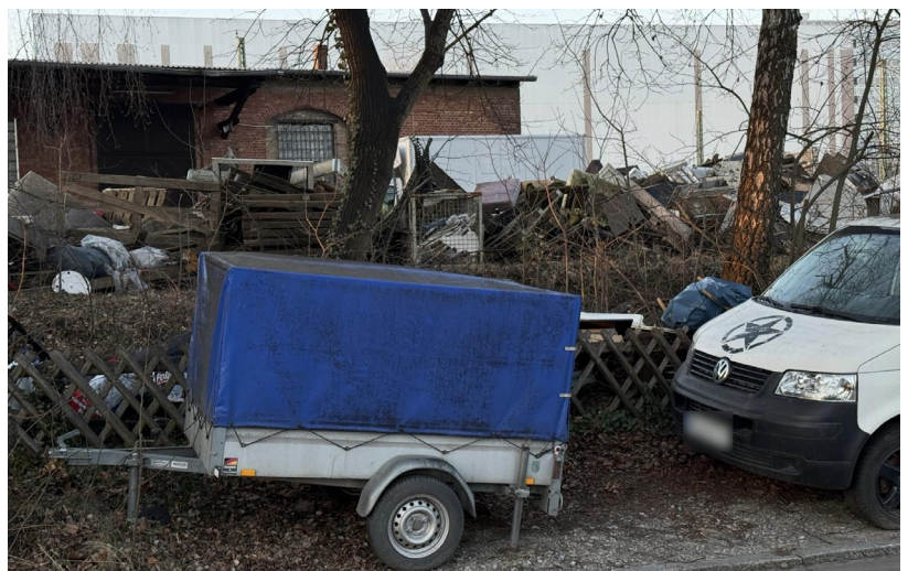
... bis zu Bauschutt – alles wird dort abgeladen