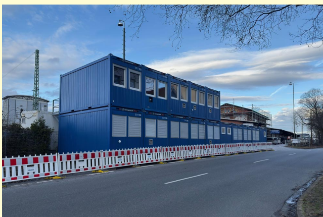
Vorbereitung der anstehenden Baumaßnahmen