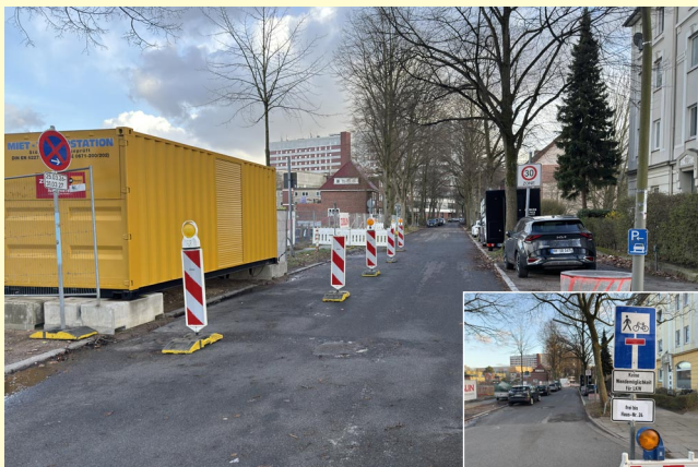
Verkehrsbehinderungen sind nicht auszuschließen