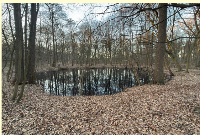
Der Teich hat wieder den gewohnten Wasserstand