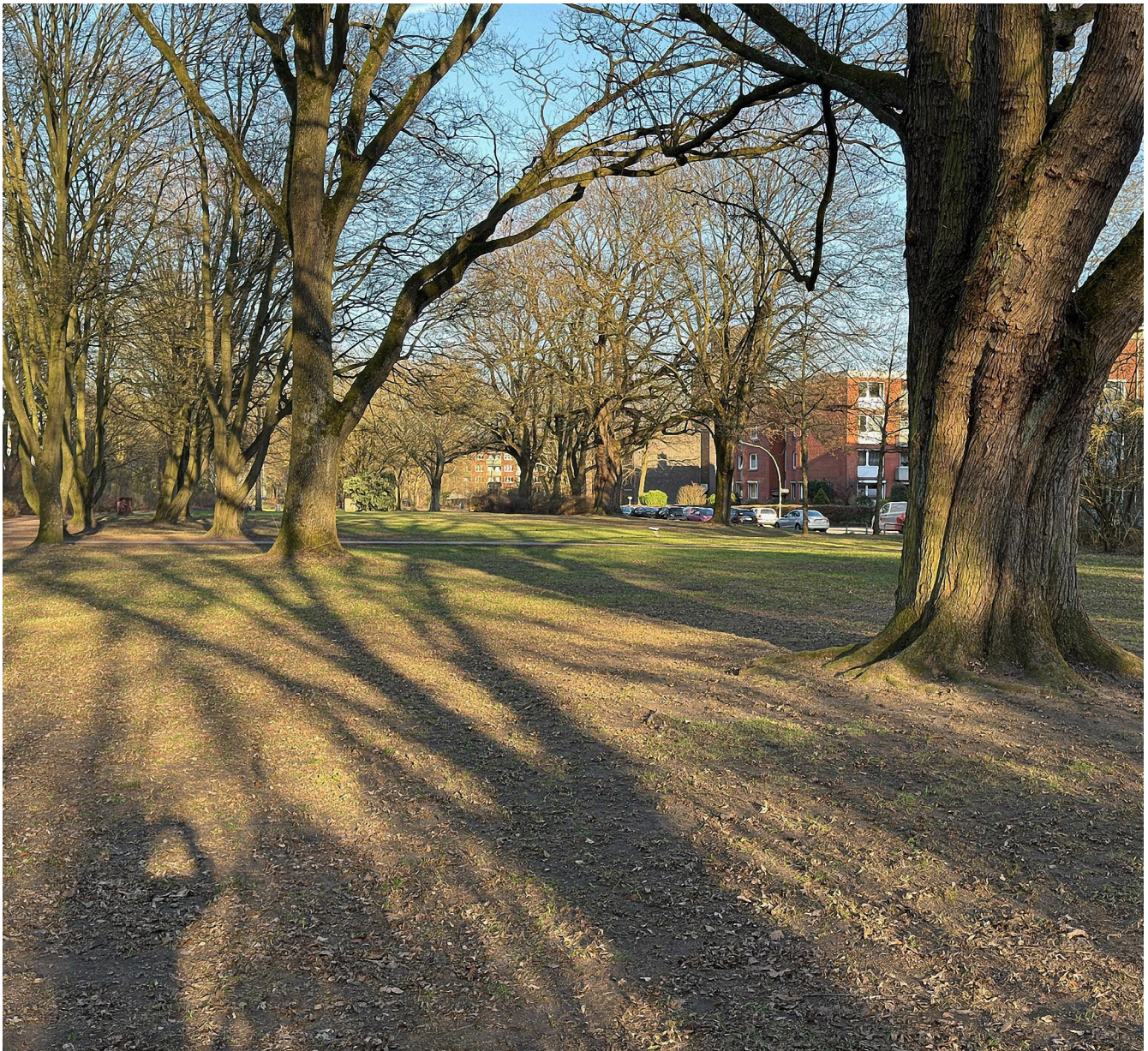
Teile des alten Baumbestandes

platz – der nach meinem Wegzug dort angelegt worden sein muss, denn ich kannte ihn nicht –, kleinere Sportplätze wie ein halber Basketballplatz oder eine Rollerbahn, mehrere Kinderspielplätze und viele Parkbänke zum Sitzen und Verweilen. Zumindest an die Kinder ist hier somit gedacht worden, denn Kinderspielplätze gibt es etwa 3–4. Ansonsten hat der Grünzug einigen alten Baumbestand, der Rest sind grüne Wiesen wie in gewöhnlichen Parkanlagen.