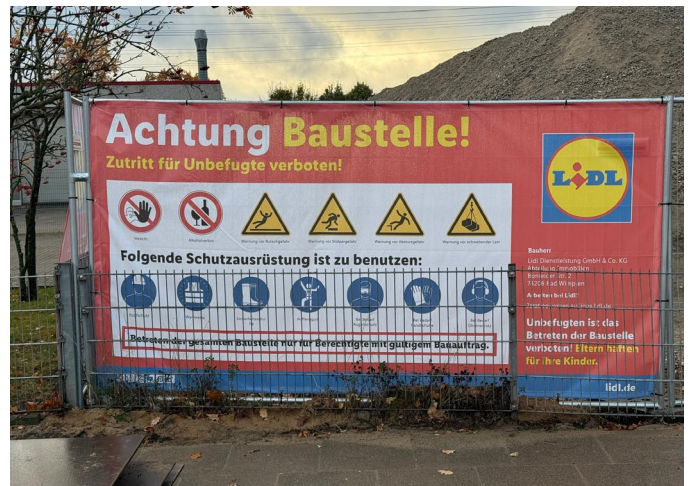
Wie es sich offiziell gehört, der Bauherr namentlich genannt: Lidl Dienstleistung GmbH & Co. KG

Auf direkte Anfrage an zwei Hauptverantwortliche für Planung und Bau an